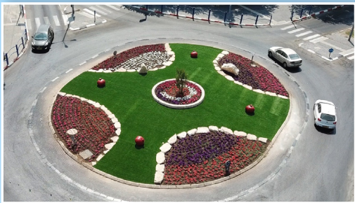
כיכר גנדי המחודשת

שאיפתי ושאיפתנו כמועצת עיר, היא שנראה כולנו יחד את מכלול הפסיפס. כל אבן המונחת מרכיבה את התמונה הכוללת. ברורה לי הצפייה והתקווה לראות שינוי מיד. בכל פעם שאני מקדמת גינה, שיפוץ המרחב הציבורי או מקימה גן משחקים